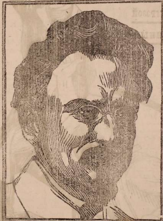
Л. Д. Троцкий

Каждый из нас должен быть политически грамотным и физически подготовленным.