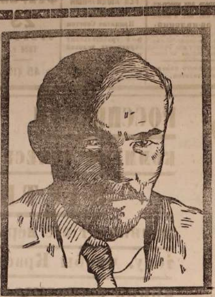
В. И. Ленин