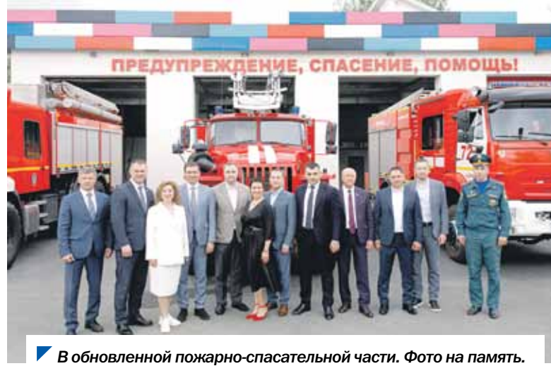
В обновленной пожарно-спасательной части. Фото на память.