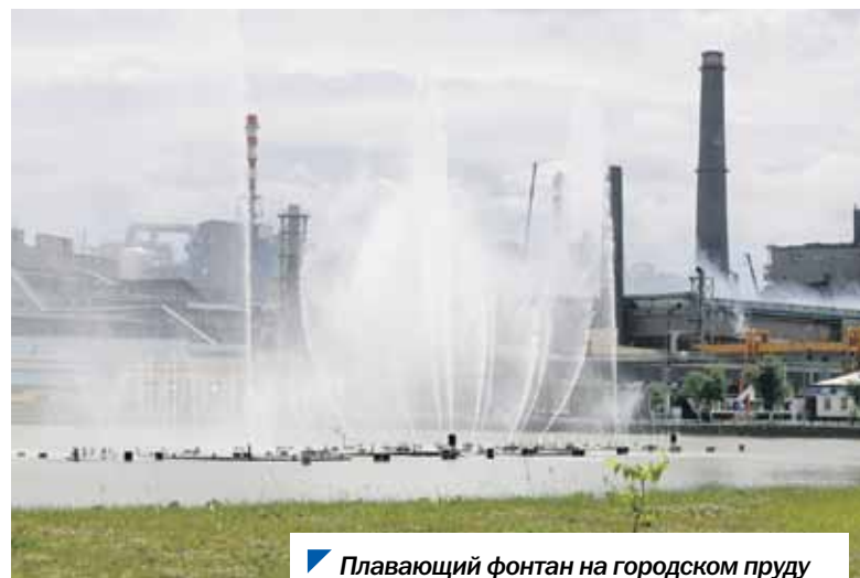
Плавающий фонтан на городском пруду особенно красив вечером.