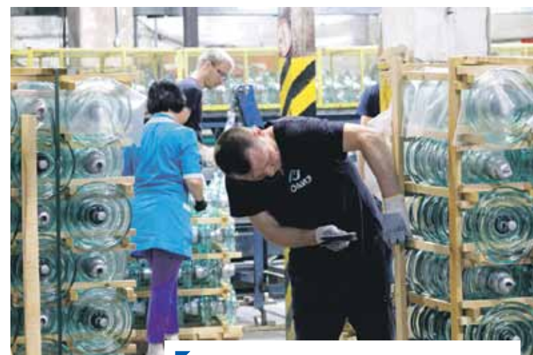
Очередной заказ готовится к отправке.

Прорабатываем сейчас договоры по поставкам продукции в новые регионы России — Запорожскую, Донецкую, Херсонскую и Луганскую области. Большой интерес к нам проявляют и зарубежные заказчики. Это в первую очередь страны Ближнего Востока. Поддержка государства сегодня для нас очень важна.