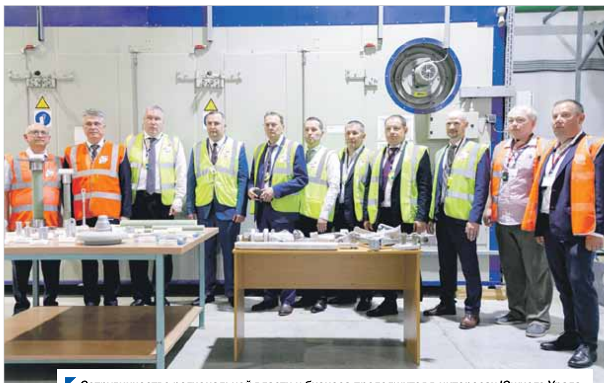
Сотрудничество региональной власти и бизнеса продолжится в интересах Южного Урала.