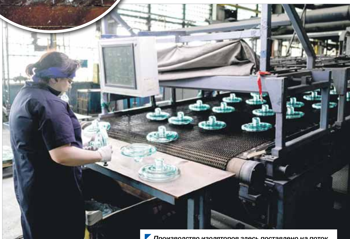
Производство изоляторов здесь поставлено на поток.