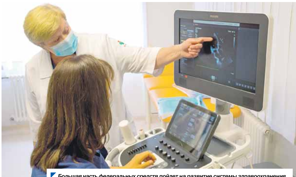
Большая часть федеральных средств пойдет на развитие системы здравоохранения.

Федеральные целевые средства, поступившие в южноуральскую казну, пойдут на конкретные социально значимые расходы области. Поправки в региональный бюджет на 2024 год одобрили депутаты комитета Законодательного Собрания по бюджету и налогам.