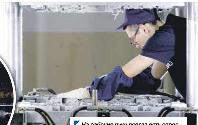
На рабочие руки всегда есть спрос.