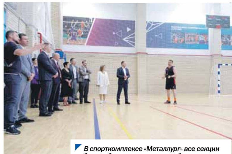
В спорткомплексе «Металлург» все секции работают бесплатно для жителей.