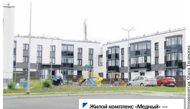
Жилой комплекс «Медный» — современная территория для жизни.