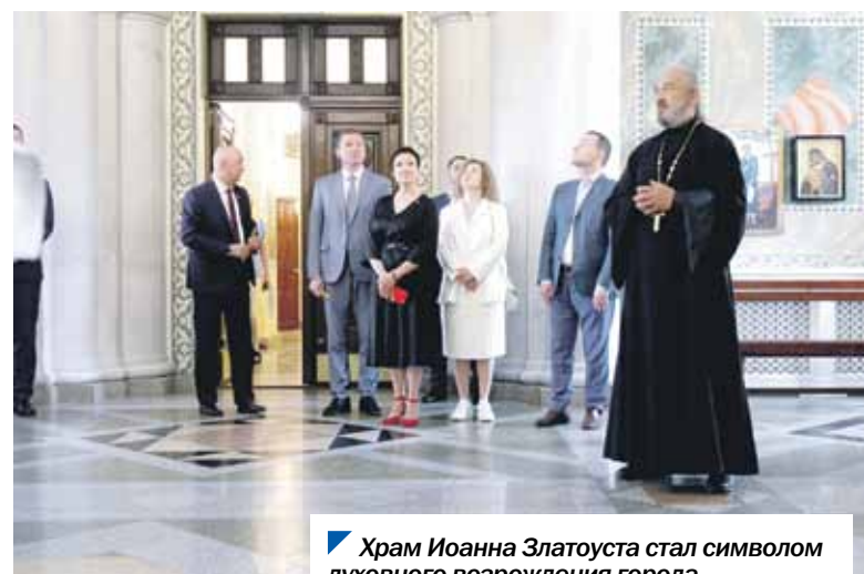
Храм Иоанна Златоуста стал символом духовного возрождения города.