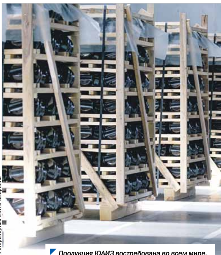
Продукция ЮАИЗ востребована во всем мире.