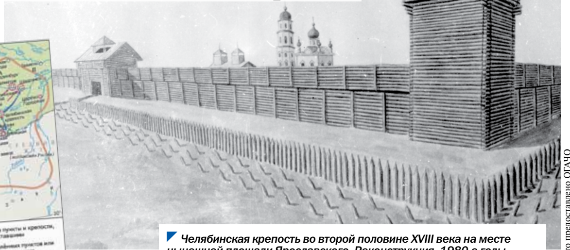
Челябинская крепость во второй половине XVIII века на месте нынешней площади Ярославского. Реконструкция, 1980-е годы.