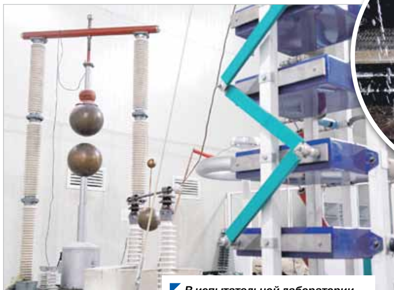
В испытательной лаборатории.