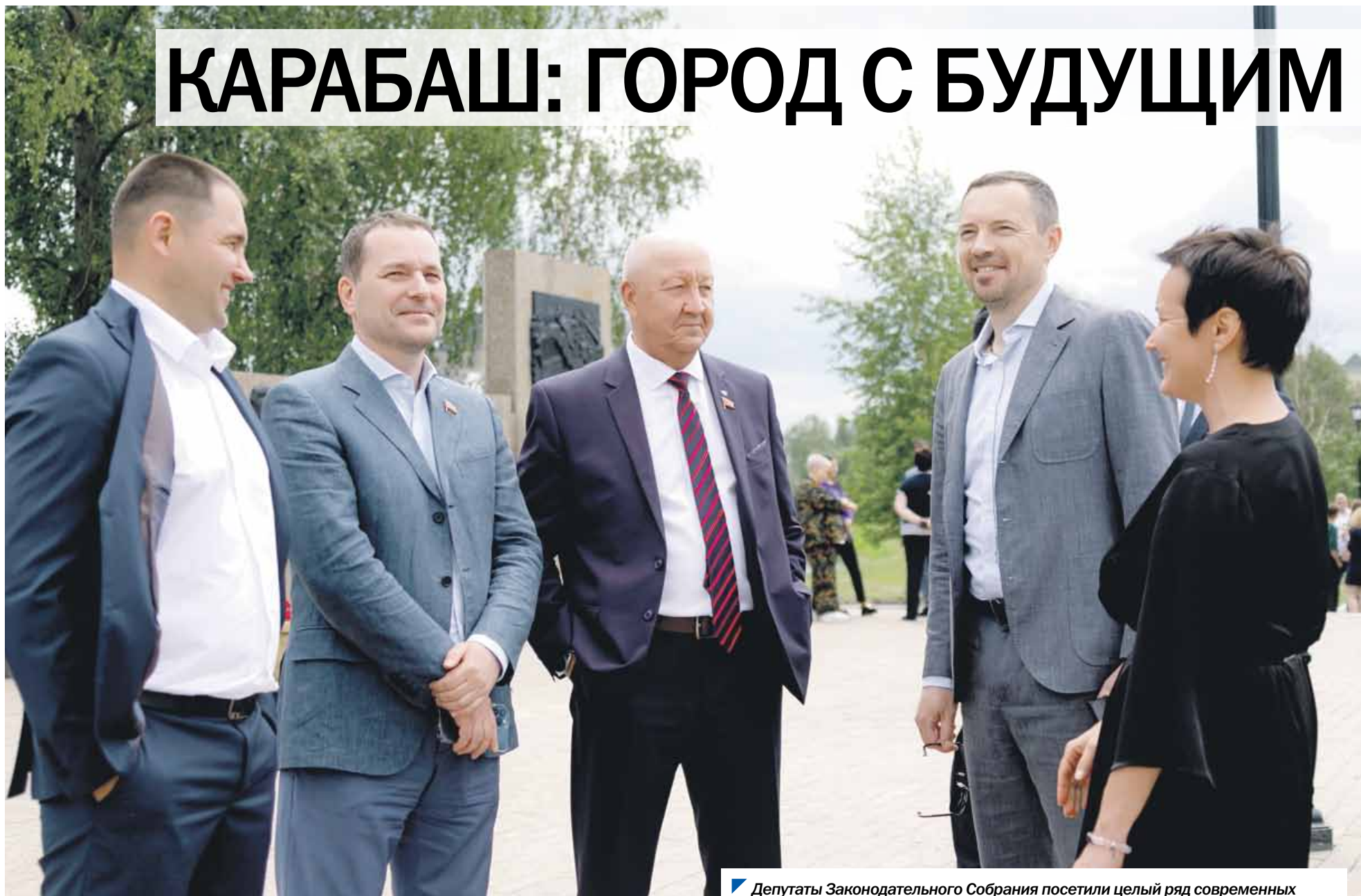
Депутаты Законодательного Собрания посетили целый ряд современных социальных объектов Карабаша в сопровождении главы города (на фото слева).

Еще недавно среди южноуральцев бытовало мнение, что у Карабаша нет будущего, а картинки в интернете, иллюстрировавшие последствия экологического ущерба, нанесенного территории в прошлом веке, называли не иначе как марсианские пейзажи. В короткие сроки ситуация поменялась в корне во многих отношениях — и в первую очередь в отношении самих карабашцев к своей малой родине. Благодаря взаимодействию региональной власти, муниципалитета и частного бизнеса город сегодня активно развивается, в том числе и в социальной сфере. Увидеть произошедшие перемены воочию решили депутаты комитета Законодательного Собрания по социальной политике, побывавшие накануне в Карабаше в рамках выездного заседания.