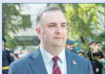
Олег ГЕРБЕР, председатель Законодательного Собрания Челябинской области:

/// Сегодня Карабаш — это прекрасный, современный, чистый город с развитой инфраструктурой, образец тесного взаимодействия власти и бизнеса. Здесь и близко нет тех пейзажей, которые в интернете называют марсианскими. Здесь люди работают, сюда приезжают отдыхать, и это не может не радовать. ///