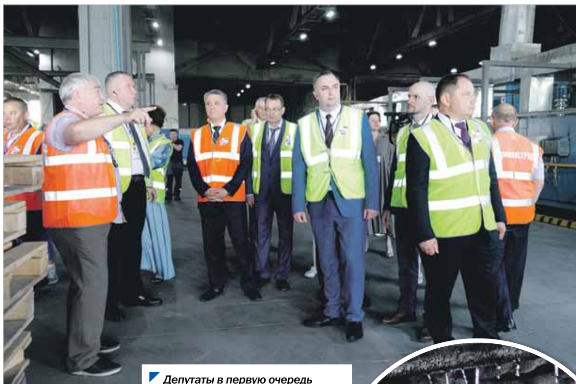
Депутаты в первую очередь посетили ряд цехов предприятия.