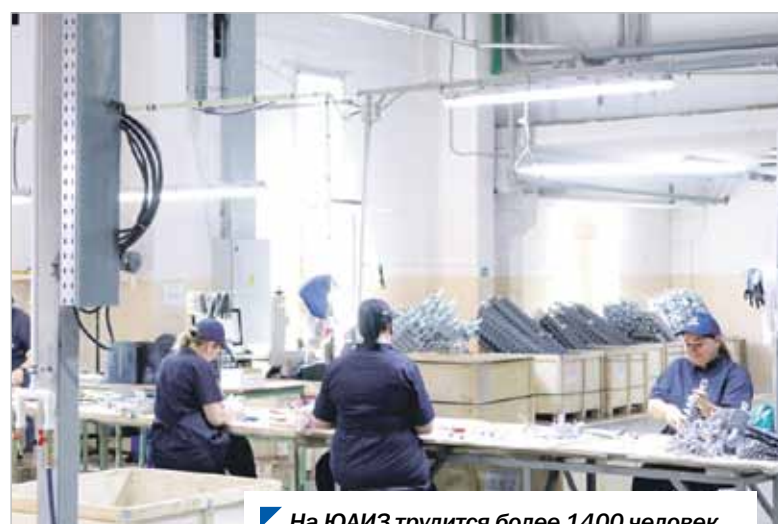
На ЮАИЗ трудится более 1400 человек.