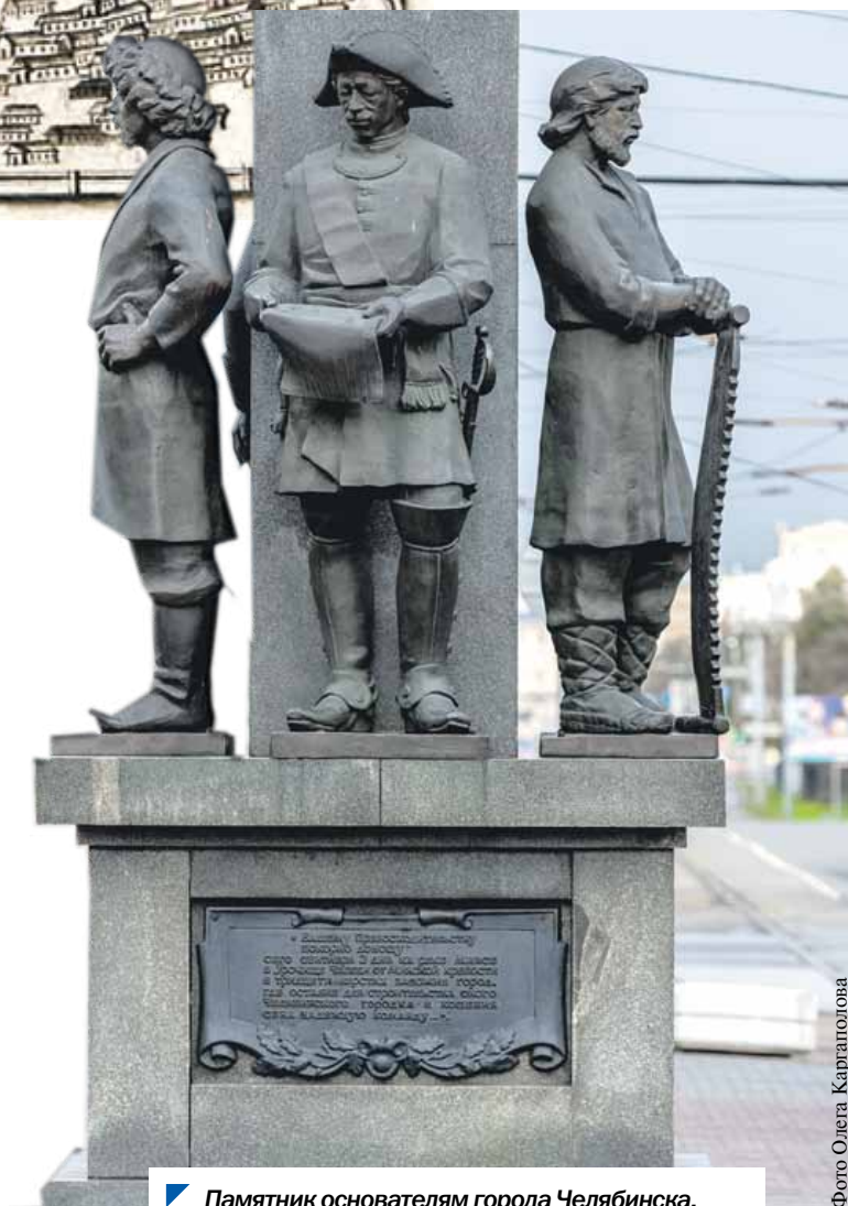
Памятник основателям города Челябинска.

Избиратели должны были соответствовать следующим цензовым условиям: быть мужчинами старше 25 лет, не состоящими под судом и следствием,