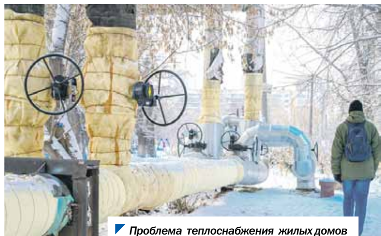
Проблема теплоснабжения жилых домов должна решаться комплексно.

Депутаты Законодательного Собрания будут держать актуальный для жителей вопрос на парламентском контроле.