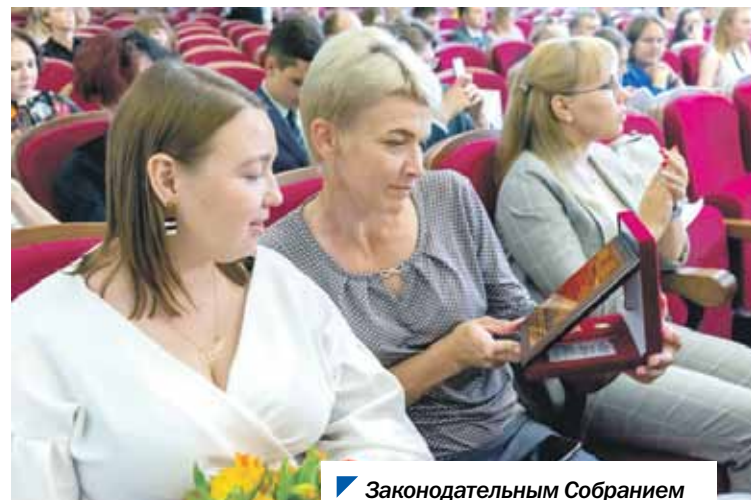
Законодательным Собранием учрежден ряд ежегодных премий.

Напомним, Законодательным Собранием Челябинской области учрежден ряд премий, которые ежегодно вручаются южноуральцам в самых разных сферах: в агропромышленном комплексе, здравоохранении, образовании, жилищно-коммунальном хозяйстве, дорожной и строительной отраслях, предпринимательстве и других.