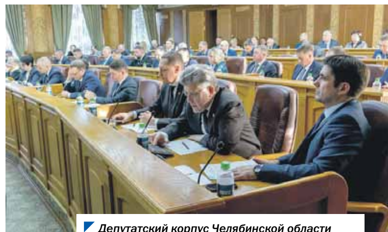
Депутатский корпус Челябинской области активно включился в законотворческую работу.

Еще один законопроект, одобренный депутатами,