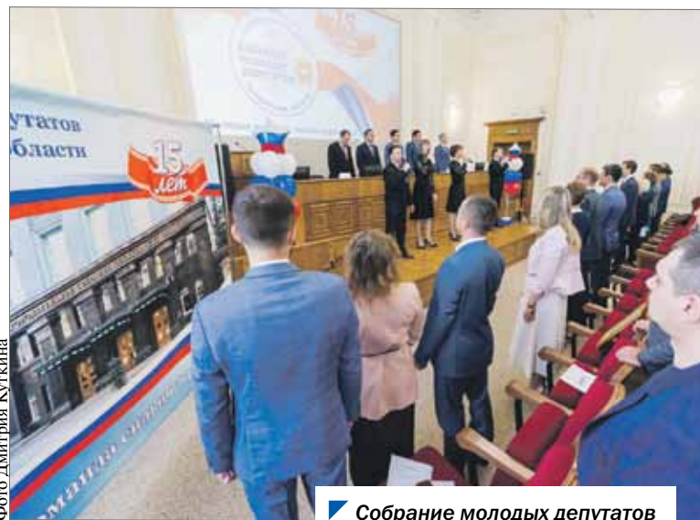
Собрание молодых депутатов было образовано 15 лет назад.

Собрание молодых депутатов состоит из действующих избранных молодых депутатов Челябинской области в возрасте до 35 лет. В его работе принимают участие депутаты из городских округов и районов, а также депутаты городских и сельских поселений.