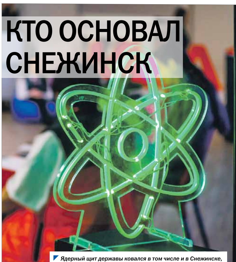
Ядерный щит державы ковался в том числе и в Снежинске, которому в этом году исполнилось 65 лет.

важный, от него зависит выполнение важнейшей задачи партии и правительства. Почему коммунисты не несут ответственности за все это?»