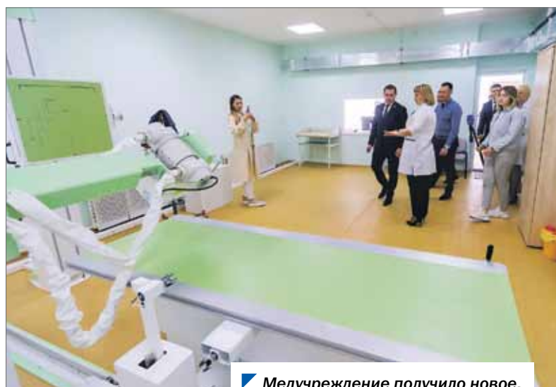
Медучреждение получило новое, современное оборудование.