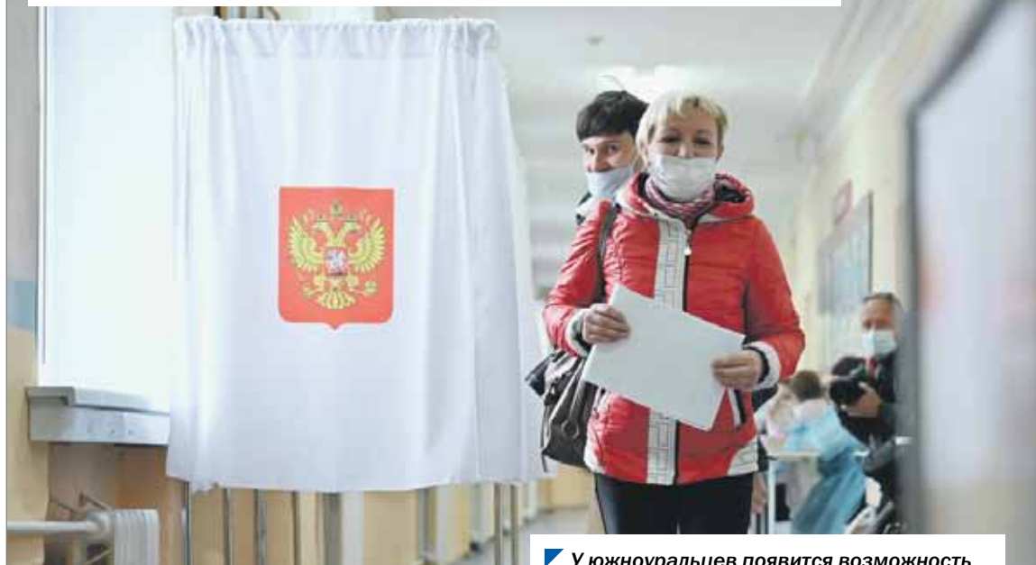
У южноуральцев появится возможность дистанционного электронного голосования.

Среди изменений, которые могут быть приняты в ближайшее время в регионе в соответствии с федеральным законодательством, — возможность дистанционного электронного голосования. Поправки в областные законы, регулирующие порядок проведения выборов и референдумов на Южном Урале, одобрил комитет по законодательству под председательством Анатолия Брагина.