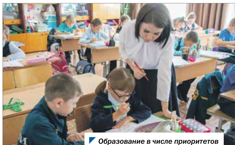
Образование в числе приоритетов региональных властей.