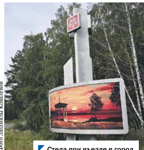
Стела при въезде в город Снежинск, 2021 год.