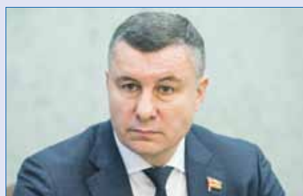
Евгений ИЛЛЕ, председатель комитета Законодательного Собрания по экономической политике и предпринимательству:

Разрешения на право организации розничного рынка, сроки действия которых истекают до 31 декабря 2026 года, продлеваются на пять лет, если до окончания срока действия разрешения управляющая рынком компания письменно не уведомит органы МСУ об отказе о продлении разрешения или о продлении разрешения на иной срок.