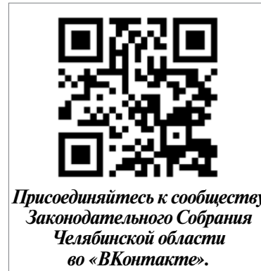
Присоединяйтесь к сообществу Законодательного Собрания Челябинской области во «ВКонтакте».

укрепление экономической и социальной стабильности, обороноспособности России, — подчеркнул Олег Гербер. — Компетентность, оперативность, организованность и слаженность действий