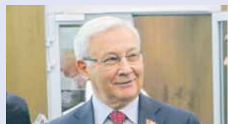
Юрий КАРЛИКАНОВ, первый заместитель председателя комитета Законодательного Собрания по бюджету и налогам:

В целом в Кунашакском районе реализуются национальные проекты в части благоустройства, экологии, строительства, культуры и образования. Еще один пример — Детская школа искусств села Кунашак, которая в рамках нацпроекта «Культура» в апреле этого года получила новое оборудование и музыкальные инструменты. К слову, здесь занимаются более 200 юных жителей района.