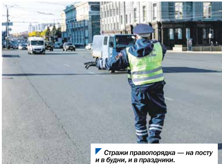
Стражи правопорядка — на посту и в будни, и в праздники.

В торжественном мероприятии по случаю праздника принял участие председатель Законодательного Собрания Олег Гербер, поздравив сотрудников и ветеранов Главного управления МВД России по Челябинской области.