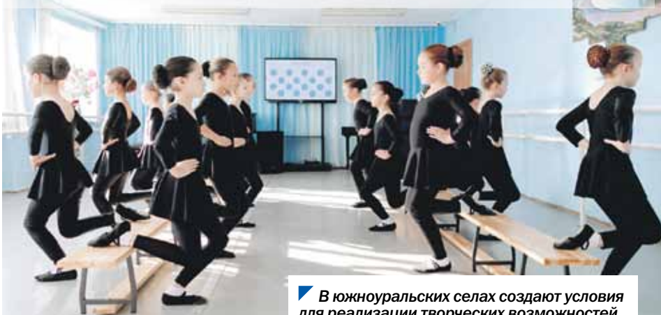
В южноуральских селах создают условия для реализации творческих возможностей.