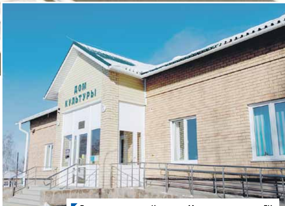
В рамках нацпроекта «Культура» в Муслимово построили ДК.

АЛЕКСАНДР ПАТРИТЕЕВ.