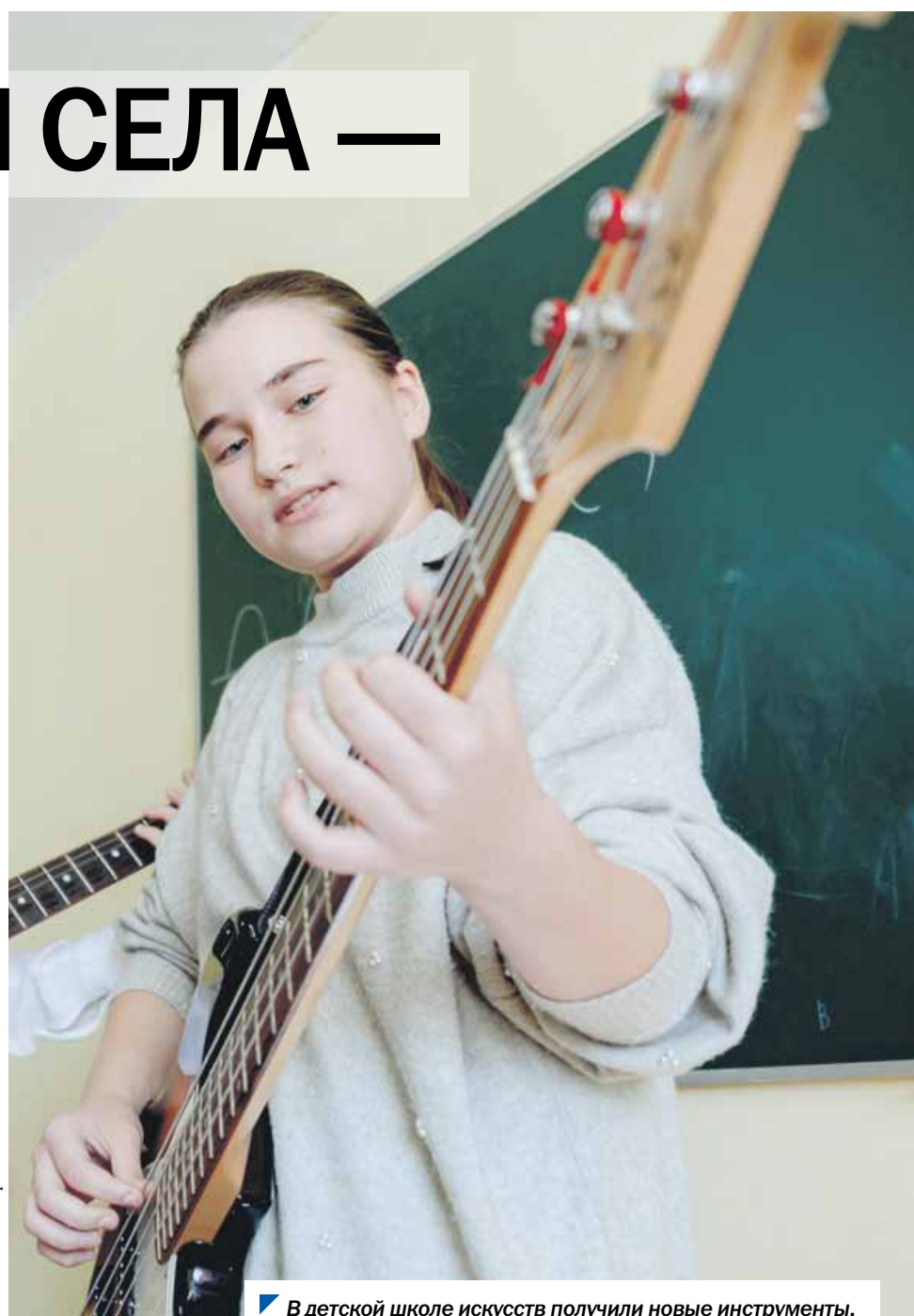
В детской школе искусств получили новые инструменты.