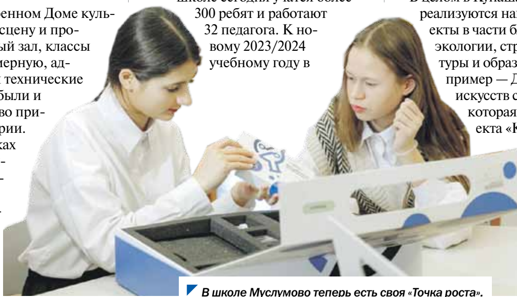
В школе Муслюмово теперь есть своя «Точка роста».

/// В нашем регионе национальные проекты действуют уже пятый год. Темпы исполнения в этом году хорошие: видим эффективную работу правительства и профильных министерств. За прошедшее время накоплен большой опыт в реализации нацпроектов. Их мероприятия востребованы у населения. Мы и дальше будем делать все от нас зависящее, чтобы намеченные показатели были достигнуты в срок. ///