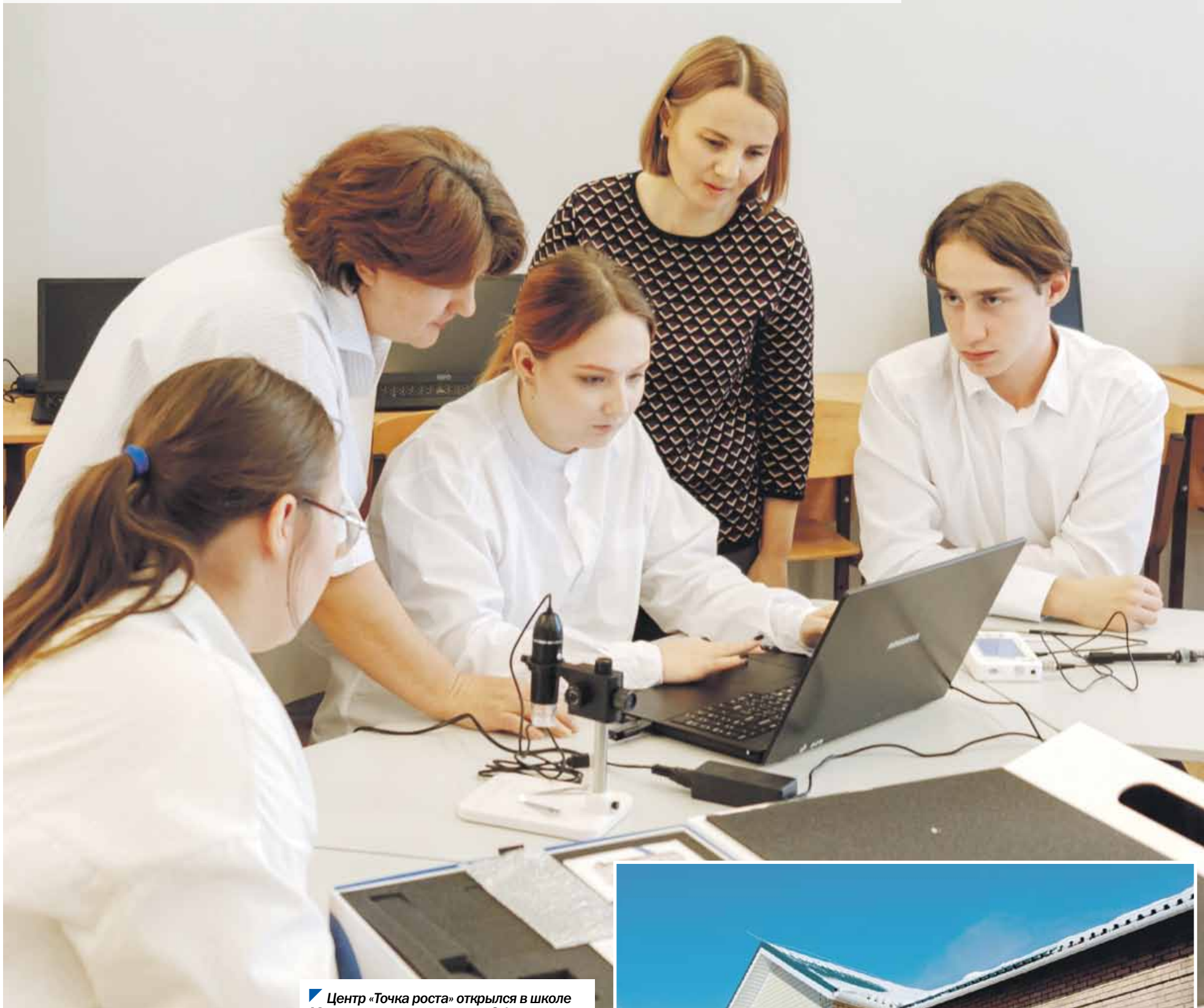
Центр «Точка роста» открылся в школе Муслимово по нацпроекту «Образование».

Национальные проекты реализуются в Челябинской области пятый год подряд. Их исполнение в своих избирательных округах контролируют депутаты Законодательного Собрания. При этом утверждать, что нацпроекты приходят только в крупные населенные пункты и касаются исключительно масштабных объектов, в корне неверно. Напротив, зачастую в центре внимания — именно небольшие сельские поселения. Подтверждение тому — село Муслимово Кунашакского района, входящее в состав округа депутата Дмитрия Мешкова. По его словам, сразу несколько национальных проектов «пришли» в это село. Читайте об этом на 5-й странице.