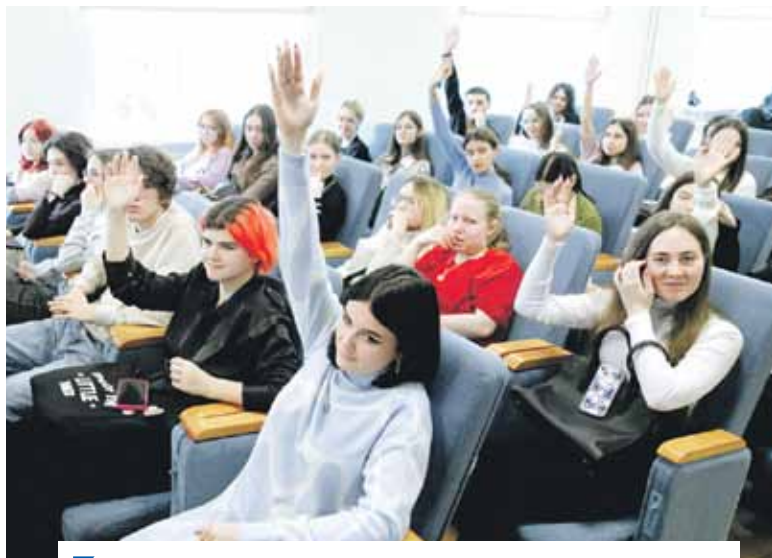
Общение со студентами ЮУрГУ длилось около двух часов.

Как подчеркнул спикер областного парламента, сегодня одна из приоритетных задач — вывести на новый уровень работу Общественной молодежной палаты при Законодательном Собрании.