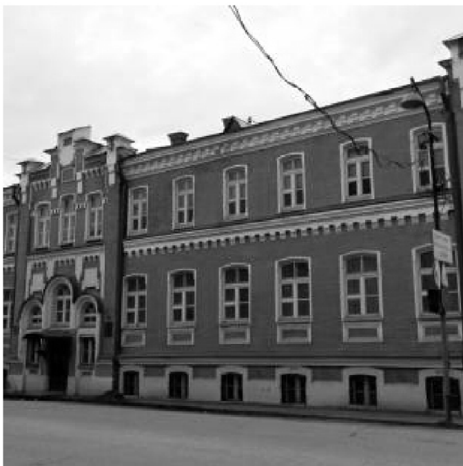
Здание бывшей Елизаветинской рукодельной школы

С точки зрения военного командования здание педагогического училища, имевшее 2140 кв. м общей площади, в том числе 1715 кв. м полезной площади, было достаточно для размещения очень маленького госпиталя – не более 200 коек. Фактически в госпитале было развернута 231 койка.