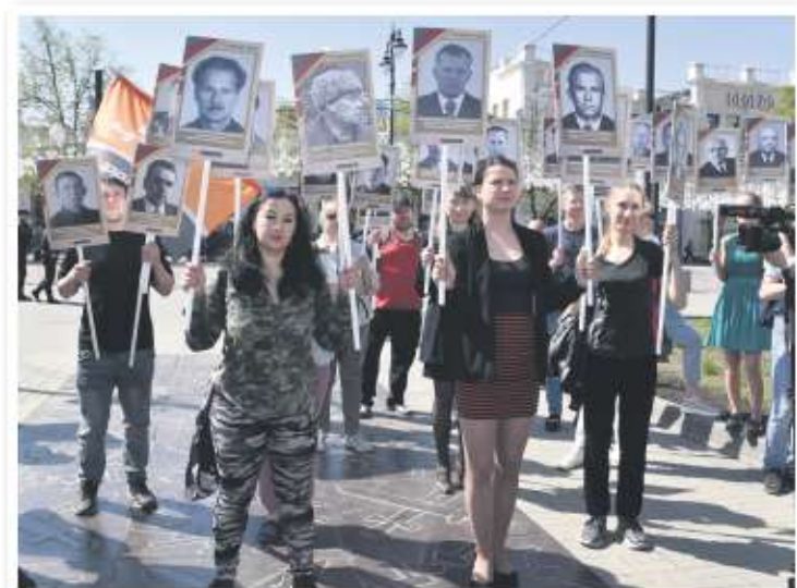
Сотрудники ЧТЗ на открытии выставки «Урал — опорный край державы»

База данных «Тракторостроители» размещена на сайте архив74.рф