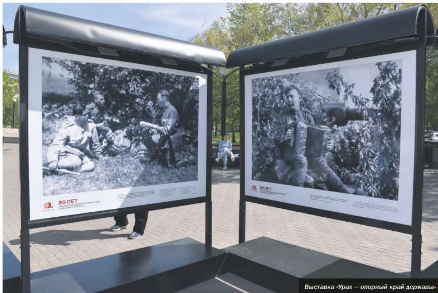
Выставка «Урал – опорный край державы»

3 мая 2023 года на бульваре Славы, у подножья памятника добровольцам-танкистам состоялось торжественное открытие фотовыставки «Урал – опорный край державы», подготовленной Объединенным государственным архивом Челябинской области. На выставке представлены фотографии из фондов областного архива, Российского государственного архива кинофотодокументов, музея трудовой и боевой славы ЧТЗ, Троицкого краеведческого музея.