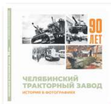
Обложка юбилейного фотоальбома

В 90-летию юбилею ЧТЗ при участии Объединенного государственного архива Челябинской области подготовил фотоальбом. В него вошли фотографии