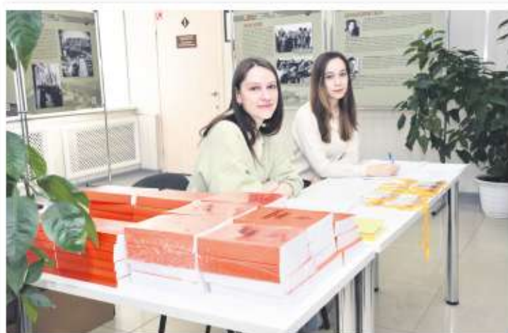
Регистрация участников конференции «Генеалогия и архивы»

Заключительным аккордом первой части конференции стало подписание договора о сотрудничестве между Объединенным государственным архивом Челябинской области и Объединенным государственным архивом Оренбургской области. Много лет назад подобное соглашение уже было подписано между архивами Челябинской и Оренбургской областей, но сейчас в Оренбурге объединились два архива, потому потребовалось юридически подтвердить сложившиеся связи. Документ подписали директора