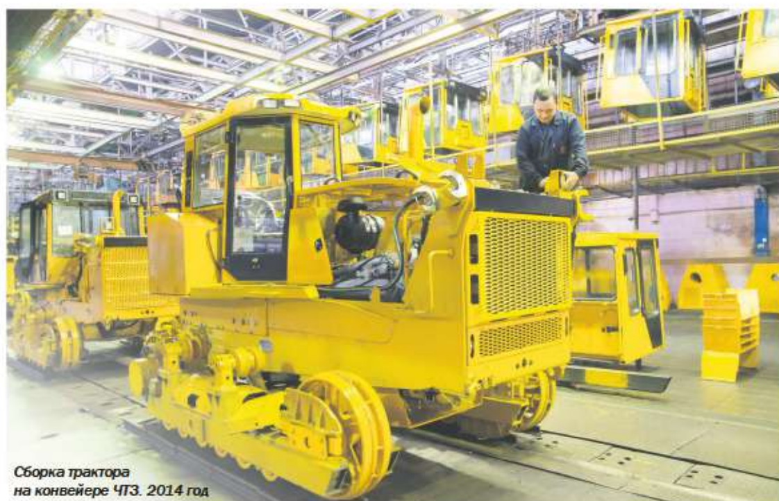
Сборка трактора на конвейере ЧТЗ. 2014 год