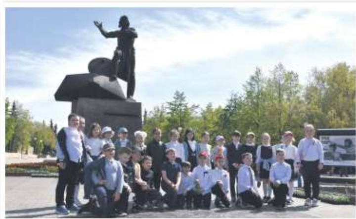
Первые посетители выставки

лица героев, фронтовая повседневность. К примеру, на одной из фотографий — экипаж легендарного танка «Гвардия». История его такова: 22 июля 1944 года танк «Гвардия» прорвался к центру Львова. Александр Марченко с группой автоматчиков ворвался в ратушу, перебил охранявших ее немцев, поднялся на башню и водрузил на ней алый флаг. Увидев советское знамя, гитлеровцы открыли ураганный огонь по ратуше и танку. При выходе из здания Александр Марченко был тяжело ранен. К нему